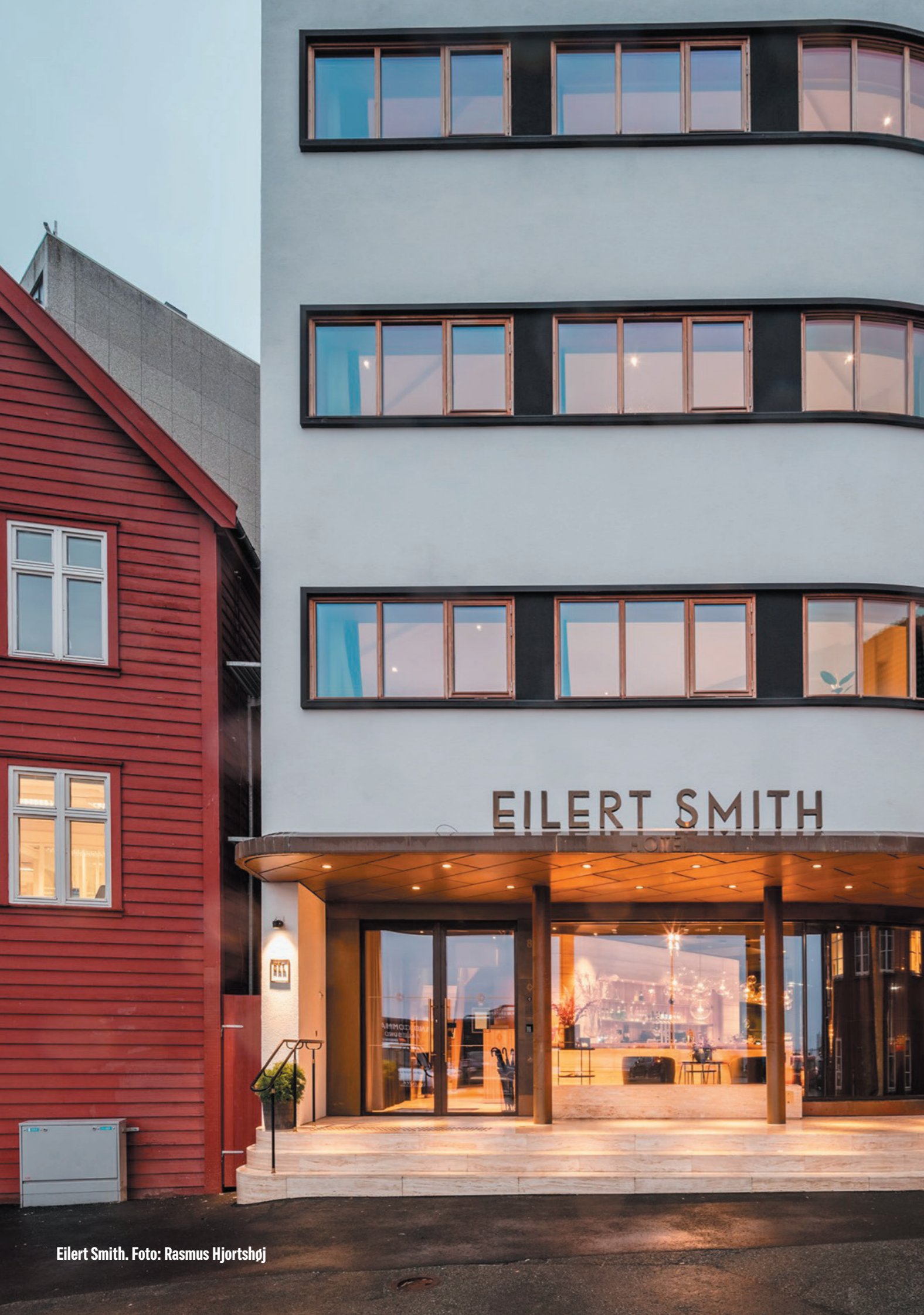
Eilert Smith.